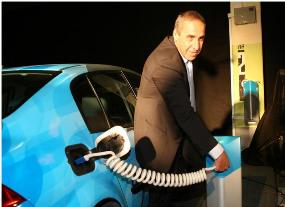
Inbetriebnahme der ersten Ladestation im Dezember 2008 in Tel Aviv

Bevor die von FCT electronic neu entwickelte Kupplung für den Ladevorgang in die Erprobungsphase gehen konnte waren umfangreiche Tests und Zertifizierungen notwendig. So zum Beispiel konnte beim Österreichischen Verband für Elektrotechnik im Dezember 2008 eine Konformitätserklärung nach IEC 60309-1:1999 + A1:2005 für den Ladesteckverbinder 16 A zertifiziert werden. Die Anforderungen in der Automobilindustrie gelten hinlänglich als sehr anspruchsvoll, da neben den extremen Klimabedingungen auch noch verschärfte Einsatzbedingungen, wie zum Beispiel durch Salz und Sand, getestet werden müssen. Doch auch hierzu hat FCT electronic eine geeignete Kontaktbeschichtung entwicklungs-technisch erprobt und eingeführt.