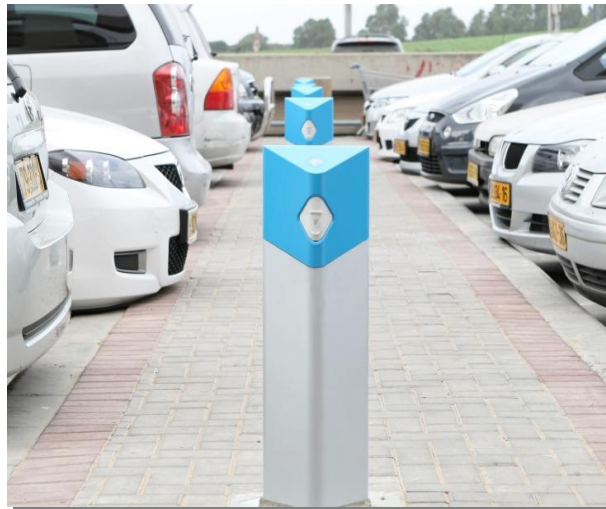
Ladestationen auf einem Parkplatz in Tel Aviv

Nach der erfolgreichen Felderprobung mehrerer hundert Ladestationen nebst Elektrofahrzeugen der Hersteller Renault und Nissan in Israel ist der flächendeckende Auf- und Ausbau der Infrastruktur für die E-Mobility geplant. Dabei sollen mehrere hunderttausend Ladestationen landesweit aufgestellt werden. Somit ist ein Aufladen der Batterien nicht nur zu Hause möglich, sondern auch an öffentlichen Parkplätzen, in Parkhäusern und den Arbeitsplätzen der E-Mobility User. Die Bereitstellung von vollautomatischen Batteriewechselstationen ist ein weiteres innovatives Konzept des Projektpartners, um für eine durchgängige Energieversorgung für „Unterwegs“ zu sorgen. Hierzu werden den Elektrofahrzeugen von vollautomatischen Batteriewechselstationen innerhalb weniger Minuten neue Batteriesätze eingesetzt. Eine Alternative hierzu sind Schnellladestationen auf den Überlandstraßen und Autobahnen um für die notwendige Energieversorgung der E-Mobility User zu sorgen.