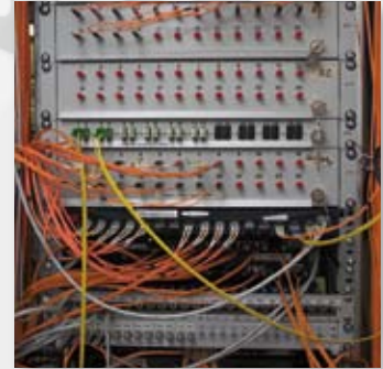
Network and Communication Technology Netzwerk- und Kommunikationstechnologie