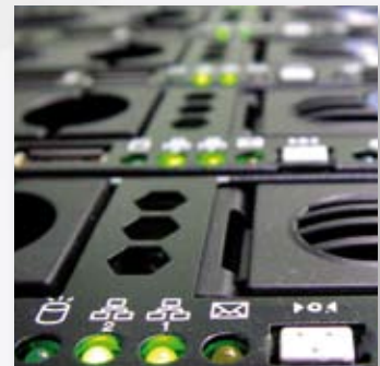
Industrial Automation Industriellautomatisierung