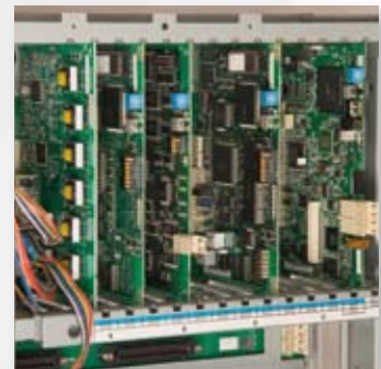
Process Automation Prozessautomatisierung