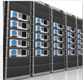
Server Architecture Servertechnologie