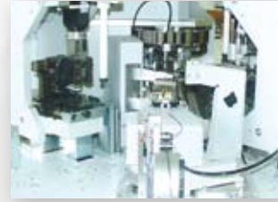
The fully automatic crimp machine customizes up to 1.200 wires per hour.

Wenn Sie im speziellen Applikationsfall Standardkomponenten nicht einsetzen können – ganz einfach! Wir modifizieren für unsere Kunden Produkte aus unserem Standardprogramm.