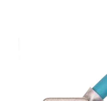
PCB in a metal hood Pláštní spoj s konektory v kovové krytce.