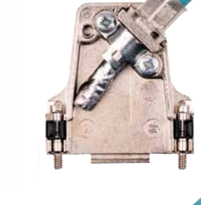
PCB in a metal hood

Die vollautomatische Crimpmaschine konfektioniert bis zu 1.200 Leitungen pro Stunde.